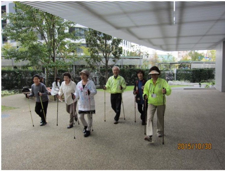
屋外でのポールウォーキング実践指導