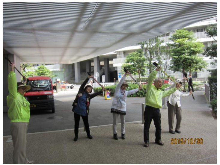
ポールを利用したの運動